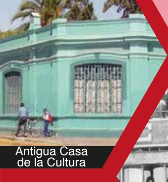
Antigua Casa de la Cultura