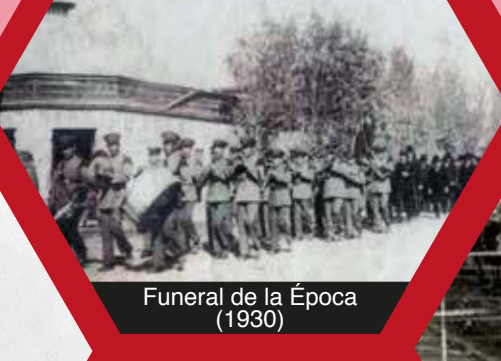
Funeral de la Época (1930)