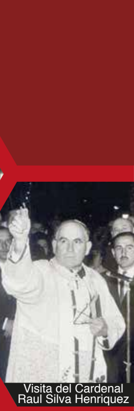
Visita del Cardenal Raul Silva Henríquez