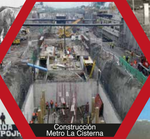
Construcción Metro La Cisterna