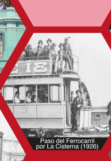
Paso del Ferrocarril por La Cisterna (1926)