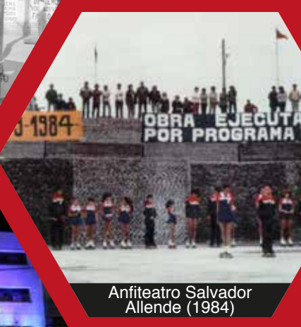
Anfiteatro Salvador Allende (1984)