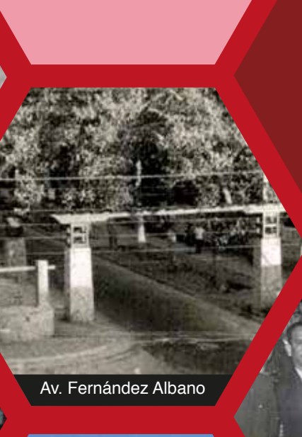
Av. Fernández Albano